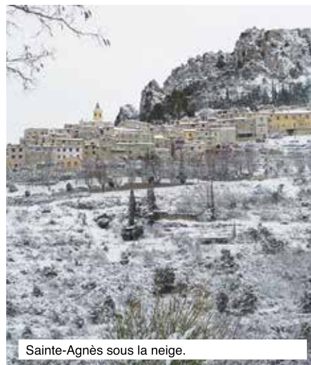
Sainte-Agnès sous la neige.

Comme vous l'avez constaté "Notre magazine municipal" porte le n°1 car il a changé d'appellation. Vous constaterez aussi que l'activité de certains élus n'est pas mentionnée dans la présente revue. Cela est du essentiellement à un manque de pagination. Bien évidemment, vous les retrouverez dans votre prochain numéro de : Sainte-Agnès "Notre magazine municipal". Directeur de la publication : Albert FILIPPI, maire. Rédaction et photos : Gérard HUGON. Création graphique : Agence ADSOLUE. Édition gratuite.