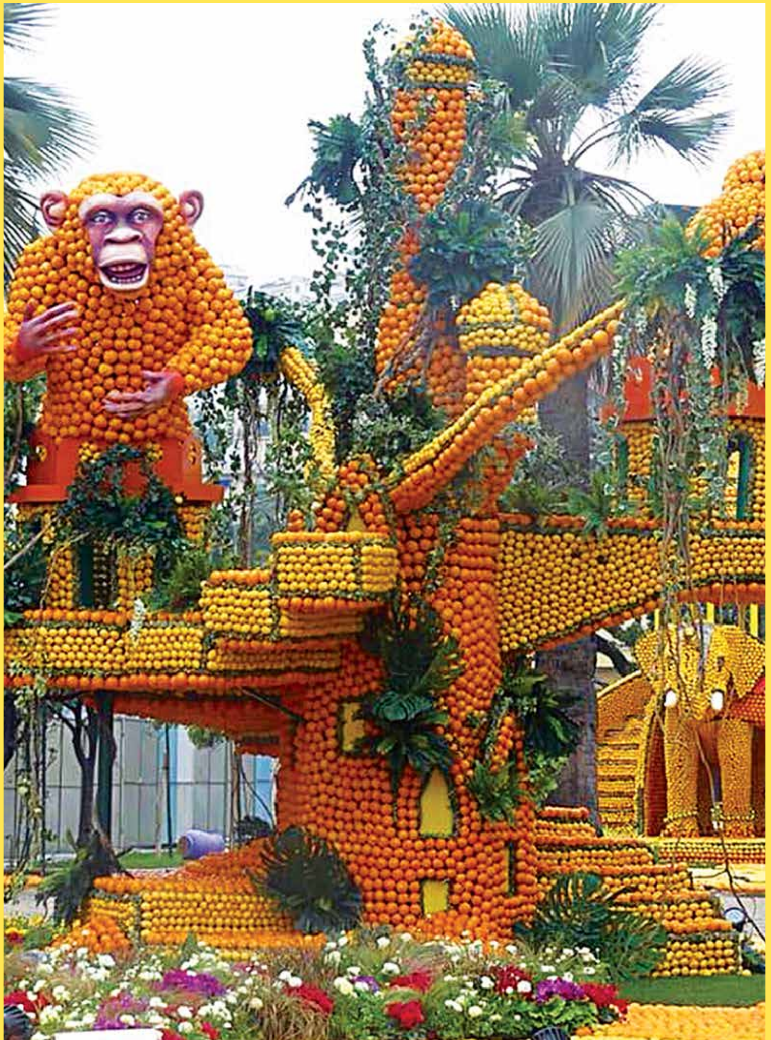
LE MOTIF DE SAINTE-AGNÈS RÉALISÉ PAR LES AGNÈSOIS "FRUITEURS" POUR LA « FÊTE DU CITRON 2018 » À MENTON.