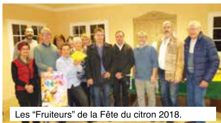
Les "Fruiteurs" de la Fête du citron 2018.