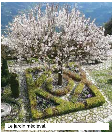
Le jardin médiéval.