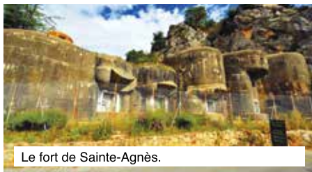
Le fort de Sainte-Agnès.