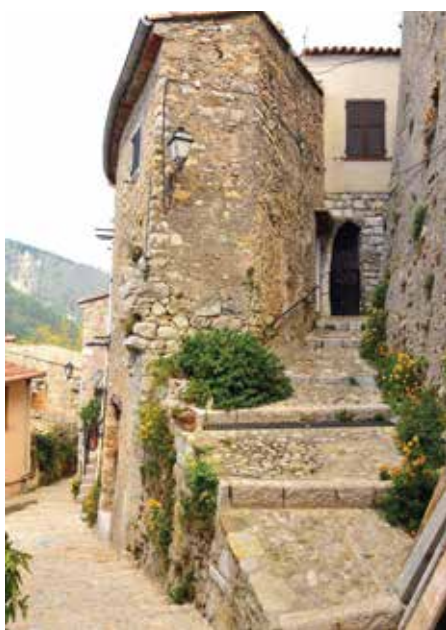
Rue de Sainte-Agnès