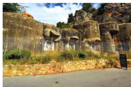
Fort de la ligne Maginot à Sainte-Agnès