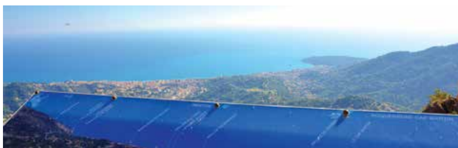
Paysage depuis la table d'orientation