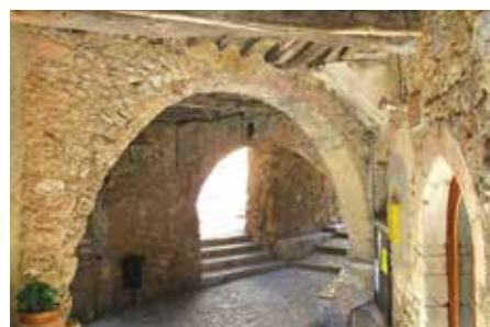
Voûtes de la rue des sarrasins