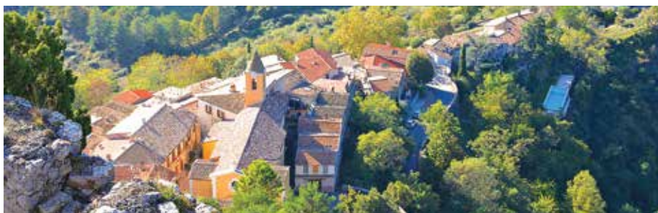
Toits de Sainte-Agnès