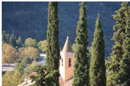
Clocher de Notre Dame des Neiges