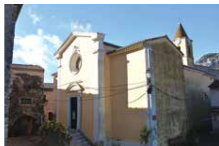
Église Notre Dame des Neiges