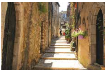
Rue de Sainte-Agnès