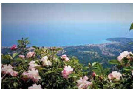
Vue panoramique depuis Sainte-Agnès